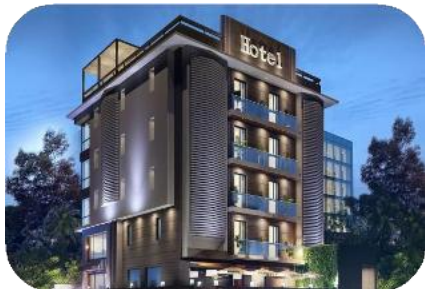
Típico 3-star Hotel